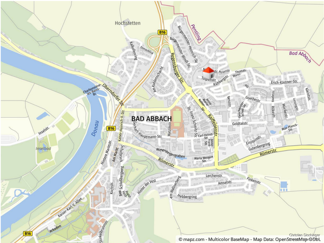
Lage im Ort